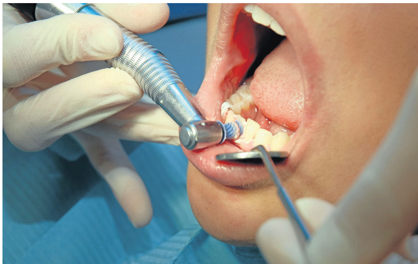
Regelmäßige Prophylaxeuntersuchungen und professionelle Zahnreinigungen in der Zahnarztpraxis leisten einen wesentlichen Beitrag zur Mundgesundheit.

Das Ziel: Risiken rechtzeitig zu erkennen und Krankheiten zu vermeiden – getreu dem Motto „Gesund beginnt im Mund“.