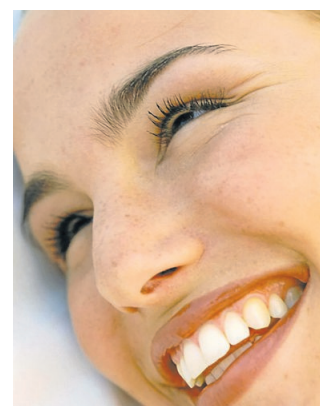
Gesunde Zähne und gesundes Zahnfleisch haben eine große Bedeutung für die Gesundheit.

Der 1. bundesweite „Tag der Zahngesundheit“ wurde am 25. September 1991 veranstaltet. 25 Organisationen aus Zahnärzteschaft und Krankenkassen waren an der Gründung beteiligt. Der jährlich stattfindende Aktionstag dient der Aufklärung von Patienten, befasst sich mit