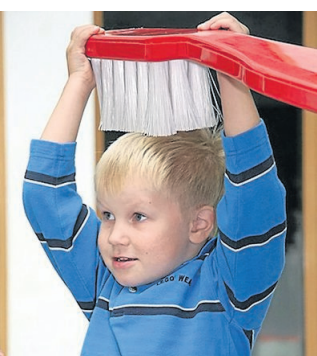
In jungen Jahren sollte die Zahnpflege spielerisch im Mittelpunkt stehen.

wechselnden zahnmedizinischen Themen und findet bundesweit großen Anklang in der Bevölkerung.